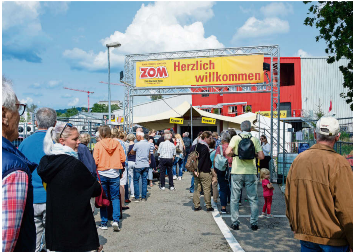
Grossandrang bereits am Mittwochnachmittag vor der ZOM-Kasse.

Wetzikon Es ist eine Ausstellung der Superlative: Die Züri Oberland Mäss 2023 – die zweite der «Neuzeit» nach Corona – ist grösser und vielseitiger als in den Vorjahren. 200 Aussteller zeigen ihr Angebot, und das Rahmen- und Unterhaltungsangebot sprengt alles bisher Dagewesene. Bereits am Eröffnungstag war der Besucherandrang gross.